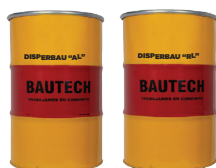
Aditivos acelerantes y retardantes de fraguado